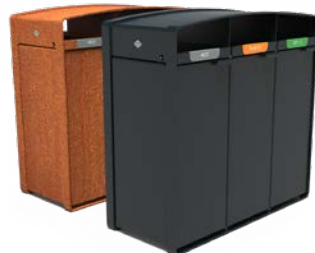
STORR 3 STROMINGEN 70L